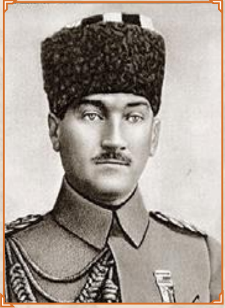
İlk Meclis Başkanı